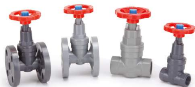
截止阀 / 截止閥