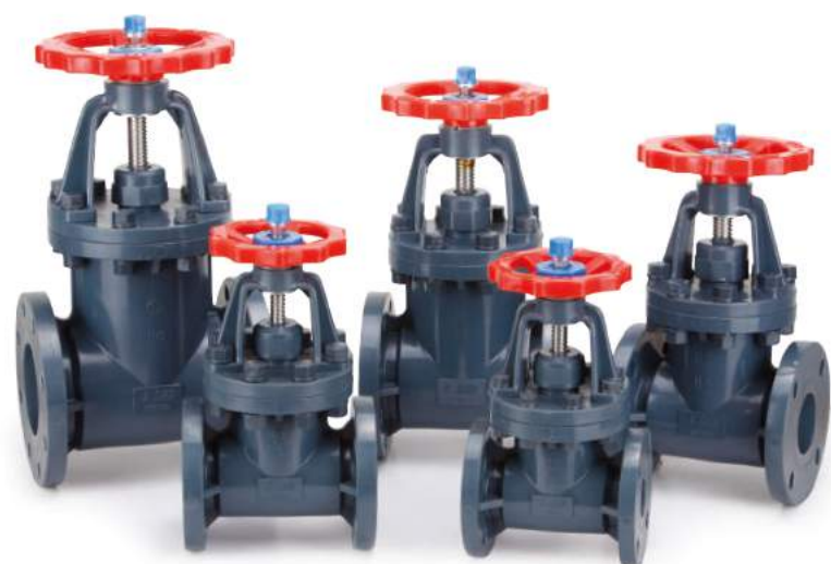
闸阀 / 閘閥