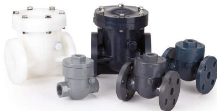
摆动逆止阀 / 擺動逆止閥