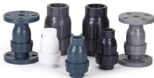
球型逆止阀 / 球型逆止閥