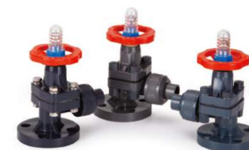
液面计 / 液面計