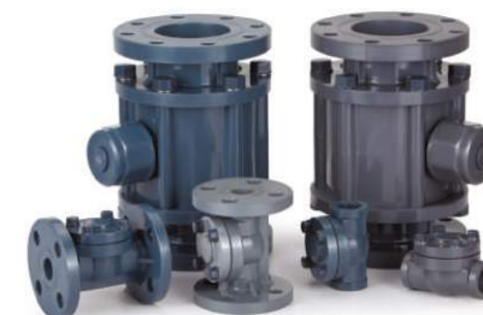
T型过滤器 / T型過濾器