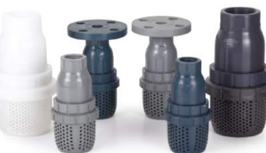
球型底阀 / 球型底閥