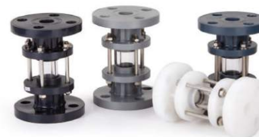
视镜 / 視鏡